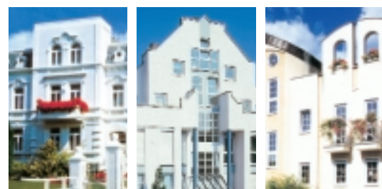
Klasický – výrazný – zaoblený. Príklady pre mnohotvárný dizajn systémov VEKA.

Každý deň si vytvárame svoj životný priestor. Viac či menej vedome. Napr., keď si zariadujeme byt. Alebo len keď si v kancelárii zavesíme kalendár alebo na pracovnom stole umiestnime novú zložku. A my sami sa tiež vždy znova „tvoríme“ nanovo. Ktoré sako si dnes vezmem? Hodí sa svetník k pančuchám? Páči sa mi ešte môj účes? Neustále sa stretávame s rozhodovaním o tvaroch a farbách, vyhľadávame, zavrhuje a pracujeme tak na našom úplne osobnom životnom štýle.